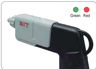
알람 출력 기능 High voltage alarm output